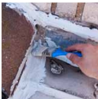
2. Rozetření štětcem. Lze aplikovat i několik vrstev.