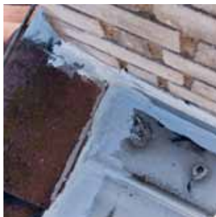
4. Membrána vytváří funkční a přitom čistý estetický detail.