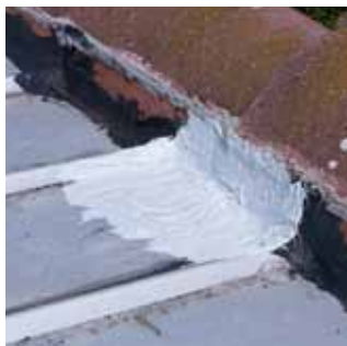
3. Po vytvrzení je membrána elastická a velmi pevná.