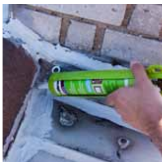
1. Aplikace membrány z kartuše.