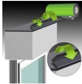
Bild 1: Band zweimal umklappen und innen bündig auf den Kasten kleben