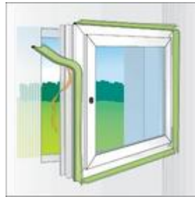
Bild 1: Befestigung der Selbstklebung von TP001 illmod i am Rahmen.