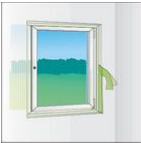
Bild 4: Nach Befestigung der Kammerleiste am Rahmen Aktivierung von TP001 illmod i durch Abtrennung der überstehenden Folie.