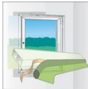
Bild 3: Befestigung der Selbstklebung von TP001 illmod i an der Kammerleiste.