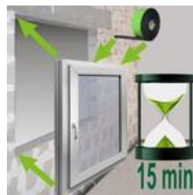
Bild 4: Das Fenster innerhalb von 15 Minuten montieren.