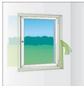
4-es kép: a kamrás szegély rögzítését követően a TP001 illmod i aktiválása