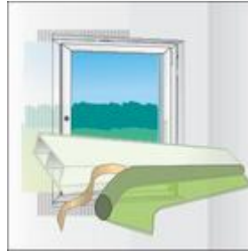
3-as kép: a TP001 illmod i felragasztása a kamrás szegélyre