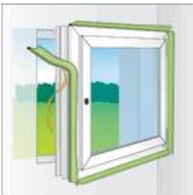
1-es kép: a TP001 illmod i felragasztása a keretre