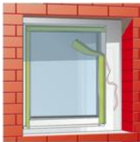
1-es kép: ragassza fel a szalagot az öntapadó réteggel az ablakkeretre