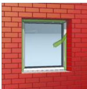
2-es kép: a kívánt időben az aktiválószinór segítségével aktiválja a tömítőszalagot.