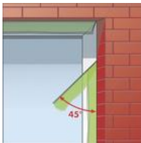
3-as kép: az aktiválószinórt és fóliát a falhoz képest 45°-os szögben húzza le.