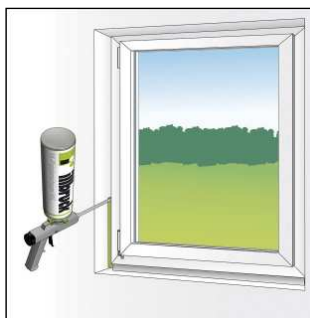
Ábra 3: Fújja be az ablakcsatlakozásokat