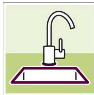
Герметизация швов с влажными условиями эксплуатации.