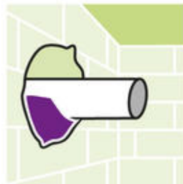
Voor het vullen van leidingdoorvoeren.