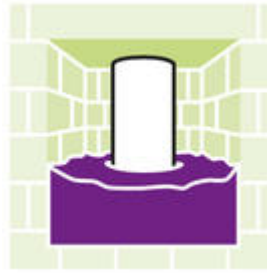
Voor het vullen van holle bereikbare ruimten.