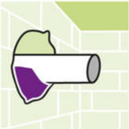
Voor het vullen van leidingdoorvoeren.