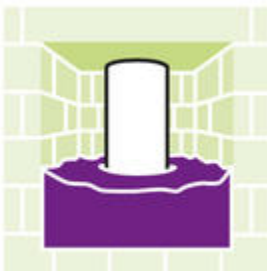
Voor het vullen van holle bereikbare ruimten.