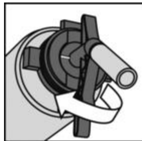
AA210 Spray Nozzle een kwartslag draaien.