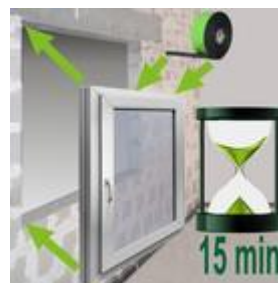
Bild 4: Das Fenster innerhalb von 15 Minuten montieren.