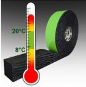
Bild 5: Lagerung und Verarbeitung von TP653 zwischen 8°C - 20°C. Hohe Temperaturen beschleunigen das Aufgehverhalten, tiefe verzögern es (siehe Vorbereitung).