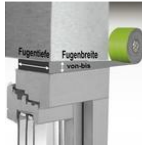
Bild 1: Die Fugenbreite sollte in der Mitte des Einsatzbereiches ermittelt werden. Die Toleranzen sollen berücksichtigt werden.