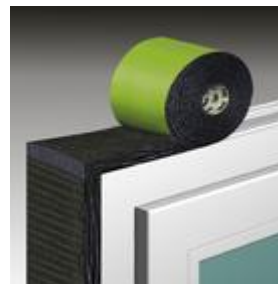
Bild 3: TP653 auf den Rahmen kleben - Seite mit dem Polymerfilm nach Innen. An den Ecken überstehen lassen.