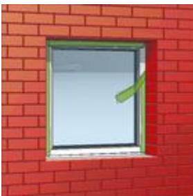
Bild 2: Zum gewünschten Zeitpunkt TP601 durch Abtrennen von Folie und Faden aktivieren.