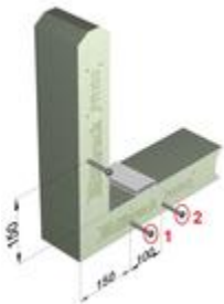
zwei Schrauben verdoppeln die Lastaufnahme je Lasteintragungspunkt