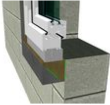
Bild 1: Fertig montierte illbruck PR007 Fenstermontagezarge mit illbruck PR008 Dämmkeil