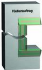
Bild 2: Kleberaupen an den Ecken