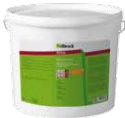
OS925 v balení 5 kg nebo 20 kg

OS925 je moderní tekutá hydroizolace pro vytvoření pevné bezešvé vodotěsné bariéry. Díky bitumen-latexové formulaci je snadno zpracovatelná štětci, válečky, špachtlemi a stěrkami. Aplikována může být také nástřikem pomocí pneumatické pistole.