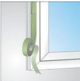
Stuik aansluiting bij kozijnmontage