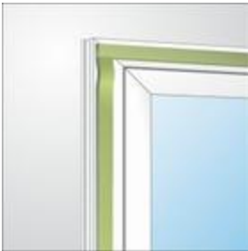
Hoek aansluiting bij de kozijnmontage