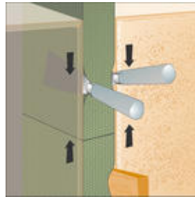
Stuik aansluiting verticale voegen