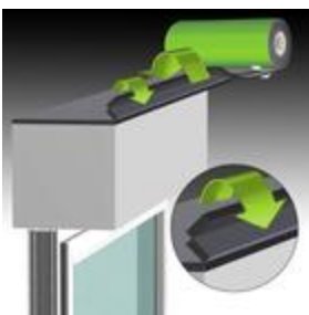
Bild 1: Band zweimal umklappen und innen bündig auf den Kasten kleben