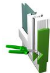
Ilustracja: W uszczelnieniu wyciąć miejsce na klin