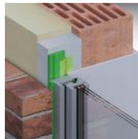
Lösungsmöglichkeit: ME350 Fensterfolie Innen VV FM230 Fensterschaum+ TP600 illmod 600