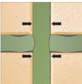
Ilustracja 4: Połączenie krzyżowe taśm. Fuga fasadowa.