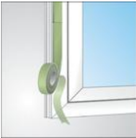
Ilustracja 3: Sposób połączenia dwóch taśm ze sobą.