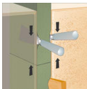
Ilustracja 2: Sposób połączenia dwóch końców taśm ze sobą.