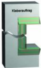
Bild 2: Kleberaupen an den Ecken