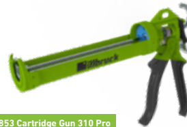
AA853 Cartridge Gun 310 Pro