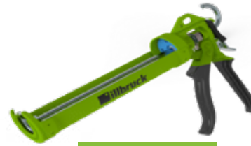
AA853 Cartridge Gun 310 Pro