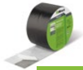
ME407 Butylband NT

Gevelelementen en draagconstructies damp-, lucht- en waterdicht afsluiten kan het beste met een butylband.