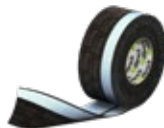
ME508 Duo Vliestape

Gebruik bij het afdichten rondom kozijnen aan de binnenzijde een tape waar overheen gestukadoord kan worden.