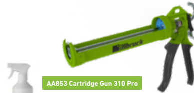
AA853 Cartridge Gun 310 Pro