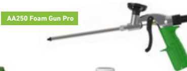
AA250 Foam Gun Pro