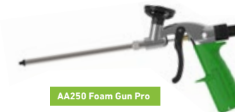
AA250 Foam Gun Pro